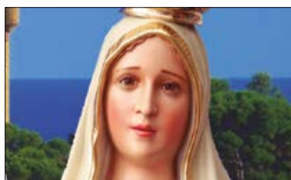
Visita de la Virgen de Fátima p.6