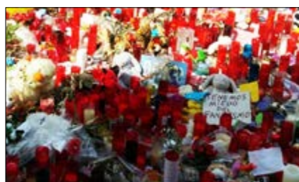
Atemptats a Barcelona i a Cambrils p.3

• setembre 2017, nº 261, exemplar gratuït