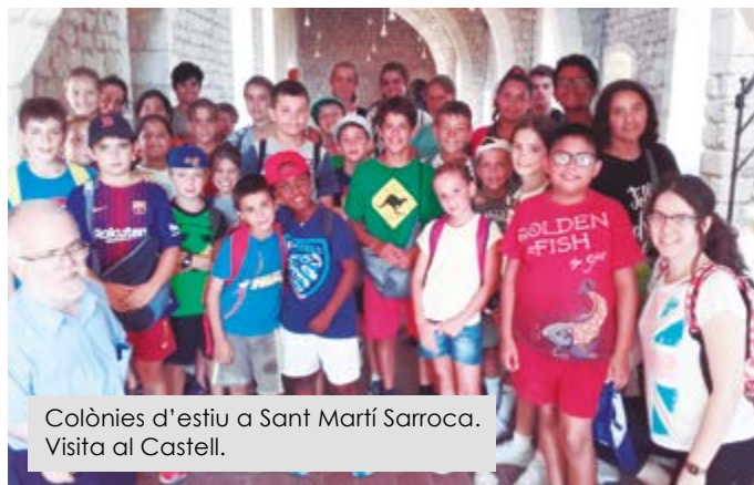
Colònies d'estiu a Sant Martí Sarroca. Visita al Castell.

Un numeroso grupo de feligreses salió de la iglesia de Santa María a las 21 h en procesión, acompañando a la Virgen hasta la explanada del parque de la "muntanyeta", donde tuvo lugar la parte central de la plegaria con canciones a la Virgen, lectura del Evangelio y oración en un ambiente de silencio y profundo recogimiento.