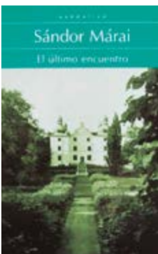
Sándor Marai, 1942, 190 págs.