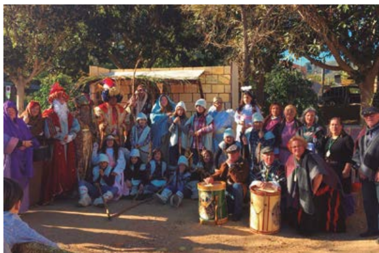
Pesebre viviente organizado por la Hermandad

más noticias en www.parroquiastelldefels.org o en redes sociales