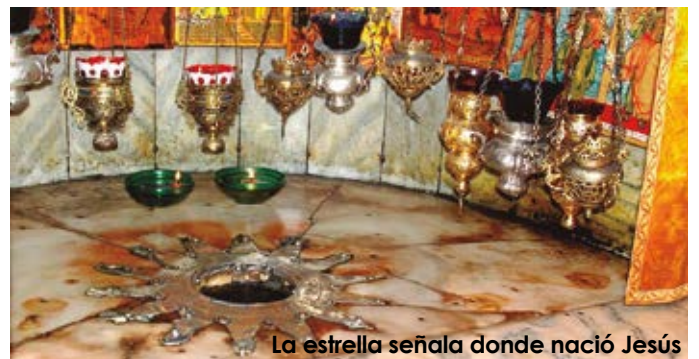
La estrella señala donde nació Jesús

No és un viatge, és una peregrinació per trobar-se amb Déu i créixer en la Fe. Per això, encara que sigui un esforç econòmic, val la pena.