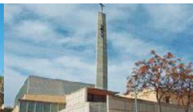
Ntra. Sra. Montserrat