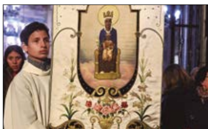
Más cerca de Jesús, ser monaguillo p.5