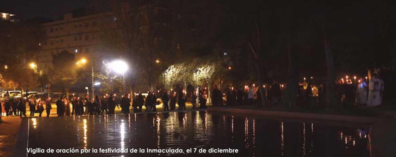
Vigilia de oración por la festividad de la Inmaculada, el 7 de diciembre