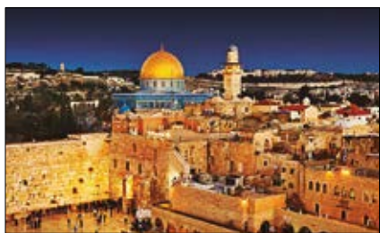
A Betlem me'n vull anar, anem a Terra Santa p.3