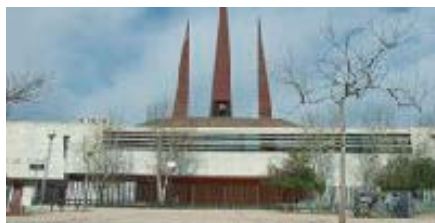
Ntra. Sra. del Carme