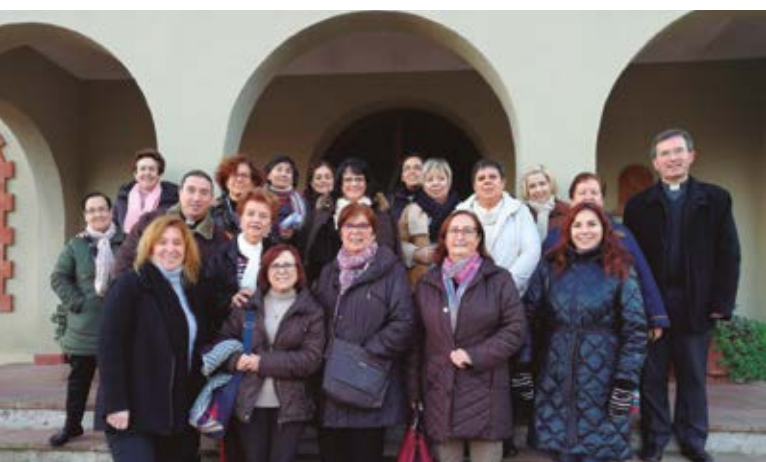
Retiro de catequistas el 9 de noviembre en Pallejá