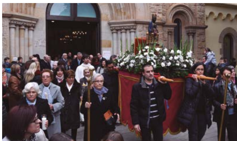
Procesión el día de la Inmaculada