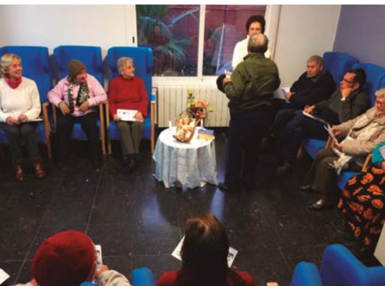
El grupo de Pastoral de la Salud celebró la Navidad en las residencias de ancianos