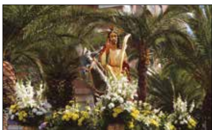
Programa de Semana Santa 2018 p.4