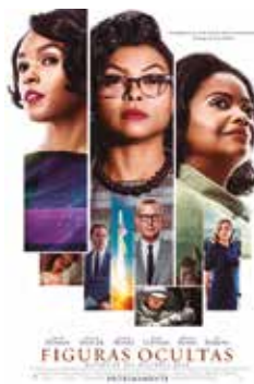
Figuras ocultas (Hidden Figures) (2016), Duración: 126 min. Género: Drama

Pone de manifiesto el gran progreso científico y tecnológico que se ha producido en estos 50 años, que se queda corto ante el cambio de mentalidad en la convivencia social que en este periodo ha habido.