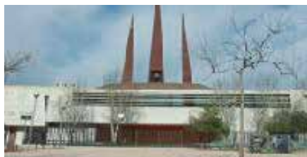
Ntra. Sra. del Carme