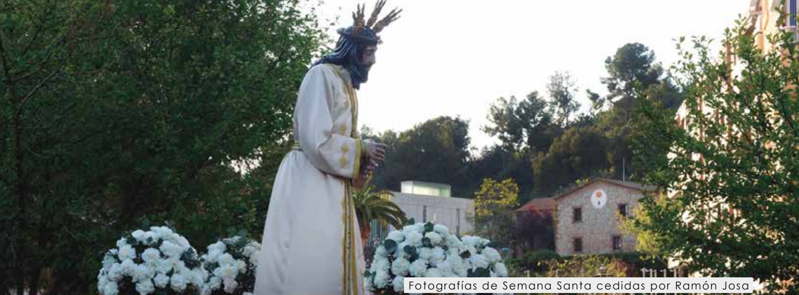
Fotografías de Semana Santa