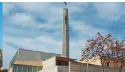
Ntra. Sra. Montserrat