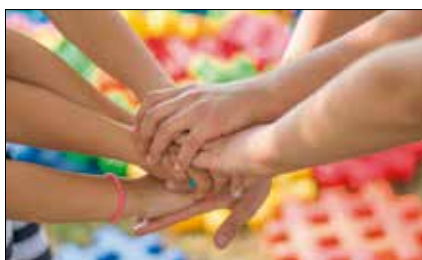
Col·lecta per Càritas Dies 15 i 16

• desembre 2018, nº 275, exemplar gratuït