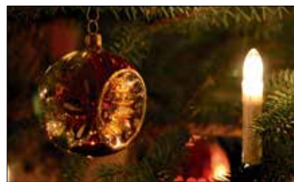
¿Cuándo nació la Navidad? p.8