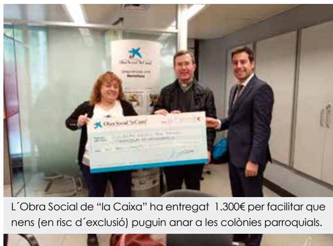
L'Obra Social de "la Caixa" ha entregat 1.300€ per facilitar que nens (en risc d'exclusió) puguin anar a les colònies parroquials.