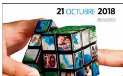
Col·lecta del Domund dies 20 i 21 p.5

• octubre 2018, nº 273, exemplar gratuït