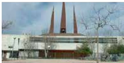
Ntra. Sra. del Carme