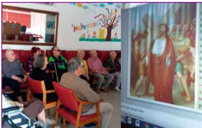
El grup de Pastoral de la Salut , durant la Quaresma, ha visitat 5 residències de Castelldefels per projectar l'audio visual del Via Crucis. Les persones han quedat molt agraïdes.

Déu ens fa arribar la seva gràcia especialment a través de els sagraments. Tots són molt importants, alguns es reben una sola vegada i altres, com la Comunió i la Confessió, Crist vol que els rebem amb freqüència. També els miracles són moments en què es "vessa" la gràcia de Déu en favor de les persones. És molt necessari recordar-ho perquè visquem més units a Déu i li donem gràcies per tantes coses que ens dóna.