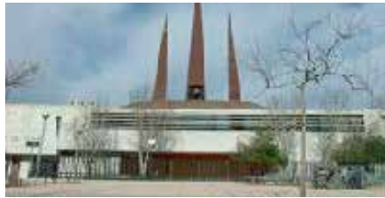
Ntra. Sra. del Carme