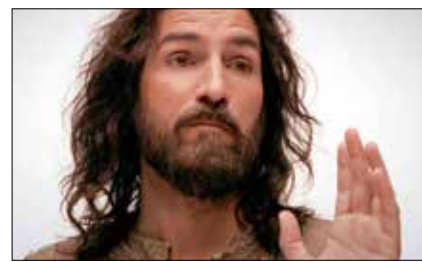
Catequesis sobre el Padrenuestro p.8