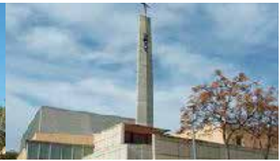
Ntra. Sra. Montserrat