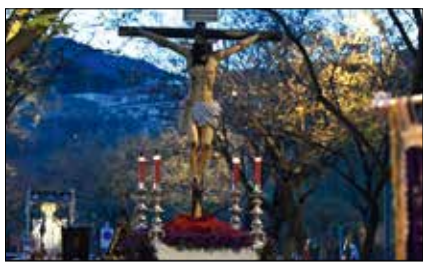
Programa de Semana Santa 2019 p.4