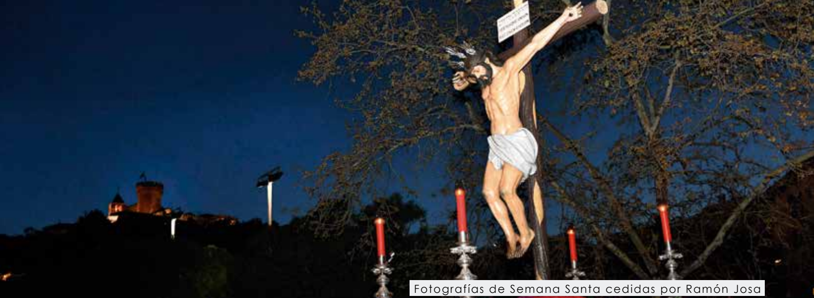
Fotografías de Semana Santa