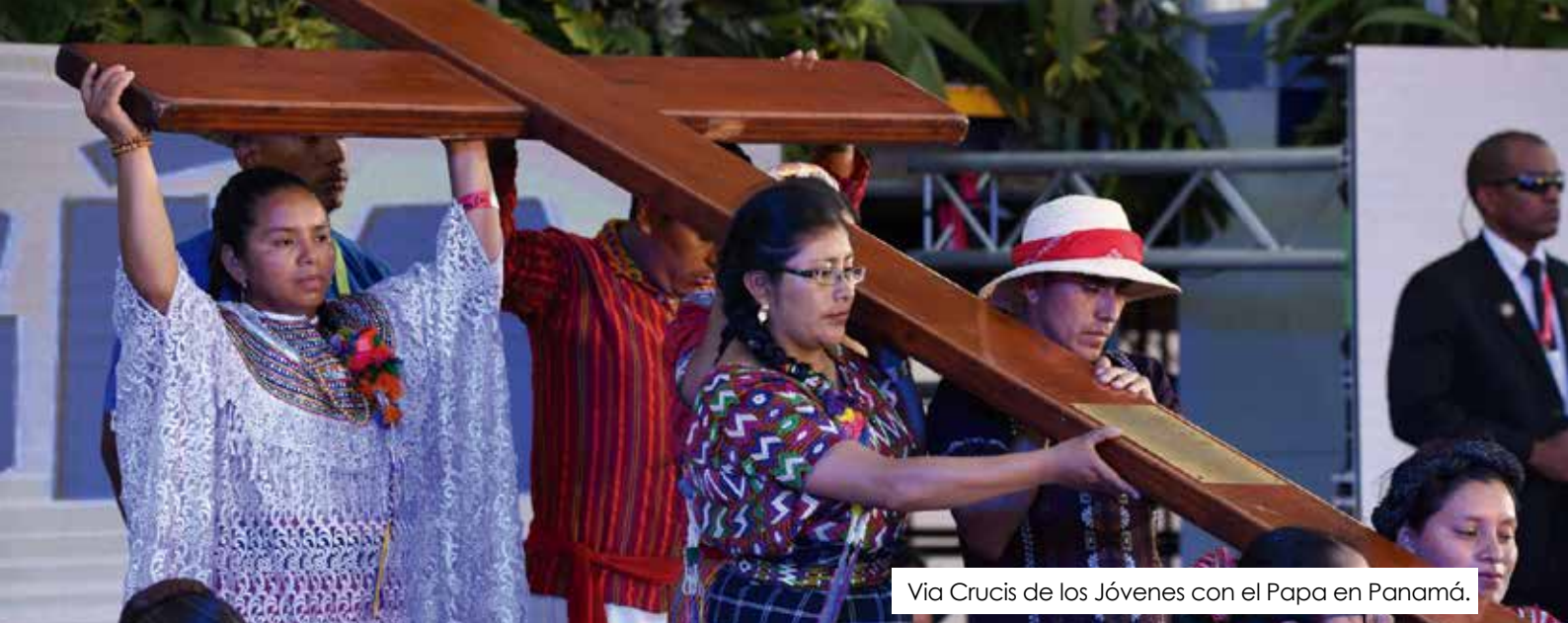
Via Crucis de los Jóvenes con el Papa en Panamá.