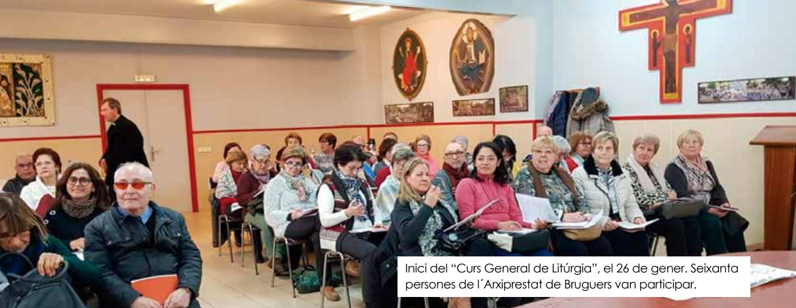
Inici del "Curs General de Litúrgia", el 26 de gener. Seixanta persones de l'Arxiprestat de Bruguers van participar.