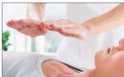
Los peligros espirituales del Reiki p.3