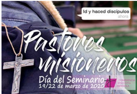
“Dia del Seminari” Col·lecta 21 i 22 de març