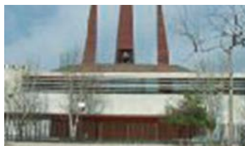
Ntra. Sra del Carme