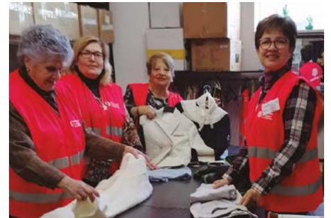
Memòria de Càritas 2019 p. 4