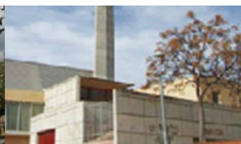
Ntra. Sra Montserrat