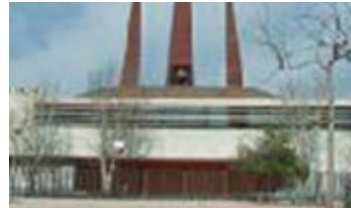
Ntra. Sra. del Carme