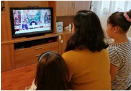
Misas en casa