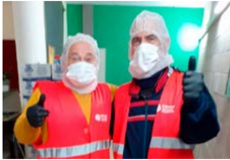
Càritas no tanca