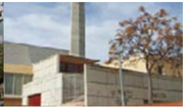
Ntra. Sra. Montserrat