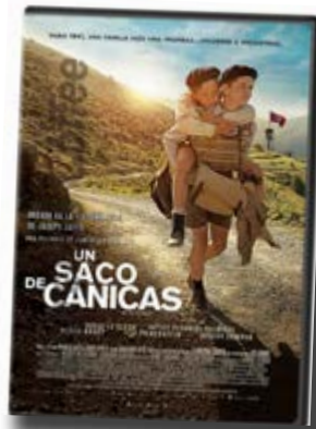
Una bolsa de canicas 2017 Drama Públic apropiat: joves Durada: 110min Director: Christian Duguay

Un exemple de com viure una situació dramàtica, que t'ha tocat viure, amb grandesa d'esperit.