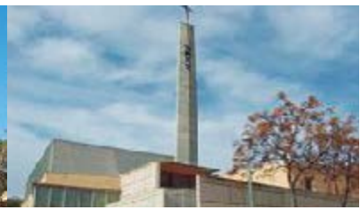
Ntra. Sra. Montserrat