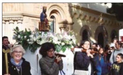
Festividad de la Inmaculada p.5

• desembre 2020, nº 296, exemplar gratuït