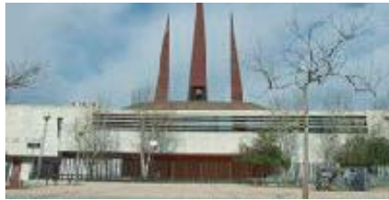
Ntra. Sra. del Carme