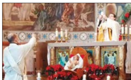
Navidad en contexto de pandemia p.5