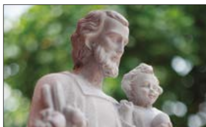
Rere les petjades de Sant Josep p.5