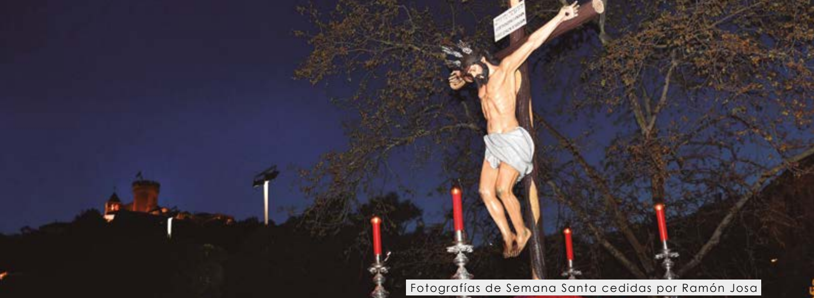
Fotografías de Semana Santa