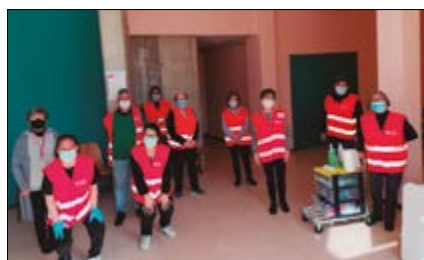
Càritas es reinventa per la crisi sanitària p.4