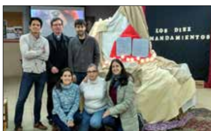
Actividades Life Teen en la parroquia p.5