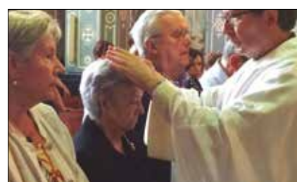
Unción de enfermos, 12 de febrero p.8