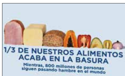
Colecta para Manos Unidas p.3